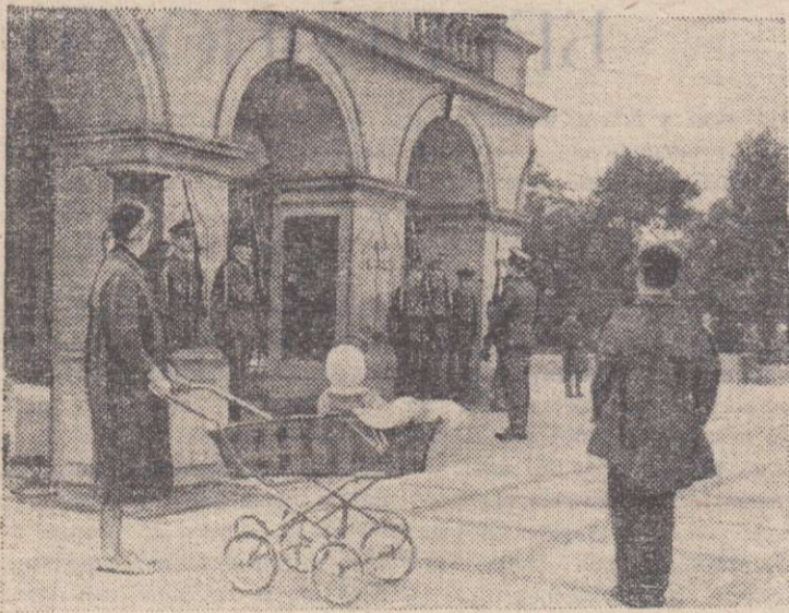
ВАРШАВА. Могила Неизвестного солдата на площади Победы. Смена почетного караула.